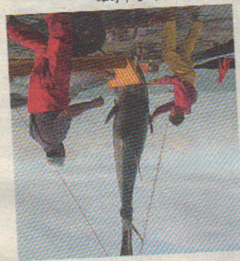
1 tonni catturati a Carloforte